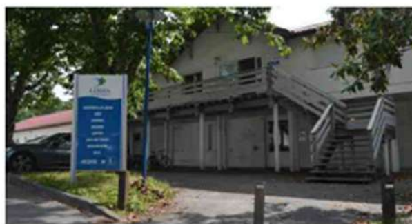
Le siège de la Coban se trouve à Andemos. >>>

Tous les habitants majeurs domiciliés sur les huit communes de la Coban (Andemos-les-Bains, Arès, Audenge, Biganos, Lanton, Lège-Cap Ferret, Marcheprime, Mios), n'ayant pas de mandat d'élu local et n'étant pas déjà membre du Codev au titre de représentant d'une association ou d'un organisme peuvent candidater. Et ce, par mail ( contact@coban-atlantique.fr ) ou courrier (46 avenue des Colonies, Andemos) avant le 14 juin 2024.